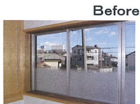
既存のアルミサッシの内側に…