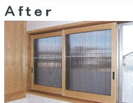
地域(西川)材活用の内窓を設置

◎ 結露でお困りのお客様から、お礼の手紙を頂戴しました。 この度は丁寧なアドバイスを頂き有り難うございます。 昨日の雪でも、家の中は結露せず、とても暖かく過ごすことができました。 頑張って二重窓にさせて頂いてよかったと心より満足した次第です。 窓枠の木の色と模様も優しくて、ちょうど壁面家具とも調和されて素敵になったと思います。 これからも一層の快適な暮らしが出来るように工夫したいと思います。